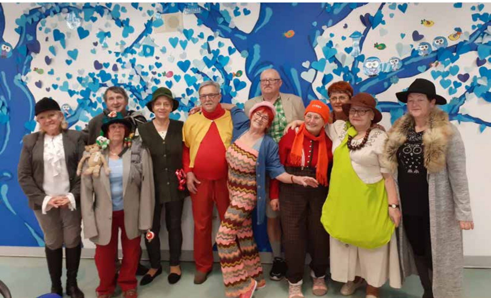
Członkowie Zespołu Teatralnego OdNowa

że Adelka jej nie chce, ignoruje ją, każe jej odejść. Niestety Choroba zostaje i zaczyna domagać się więcej i więcej uwagi.