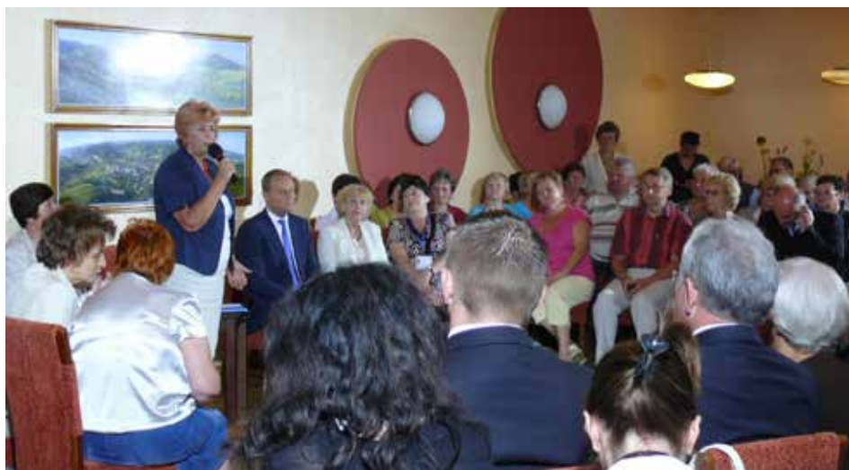
Premier Donald Tusk w Szczawnicy

Utworzenie urzędu Ministra ds. Polityki Senioralnej może mieć przełomowe znaczenie dla środowiska polskich seniorów i oznacza podniesienie rangi zagadnień w polityce publicznej, które ich dotyczą. Jest nadzieja, że sprawy osób starszych znajdą odpowiednie miejsce w publicznej agendzie i konsekwentnie podejmowane będą działania dla starszego pokolenia we współpracy z udziałem młodszych generacji.