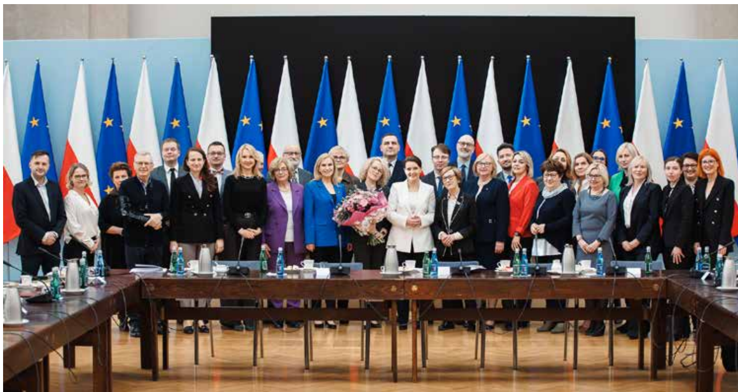
Członkowie Rady do spraw Polityki Senioralnej